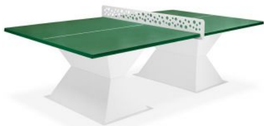
Table de ping-pong en matériau composite haute densité.