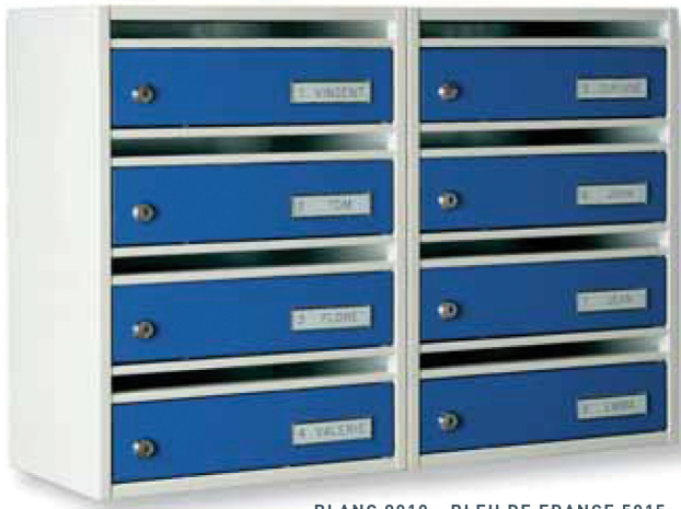
BLANC 9010 - BLEU DE FRANCE 5015.